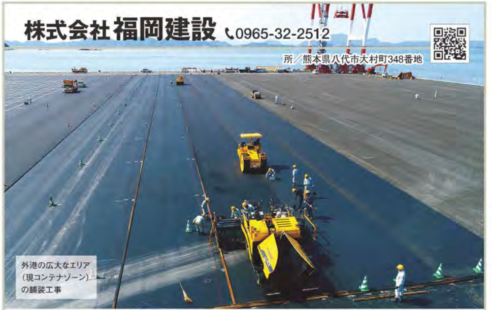
外港の広大なエリア(現コンテナゾーン)の舗装工事