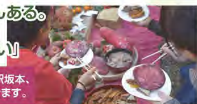
2020年より12月の新月に開催する『赤の祭り』を創りました。鎮魂と再生の祈りをささげる祭りです。色を失った故郷を、鮮やかな赤い食べ物で彩ります。

「祭りを終わりでまで見届けたい。皆さんの高齢化により、ある日確実に終わると思っています。今日も世界中のどこかで何かが消滅している。自然に抗わず、今残っていることが素晴らしいからその事実を皆さんに知ってもらいたい。だからこそ、私は今の記録を残したいと思った。私の取材は『看取り』みたいな思いもあります」