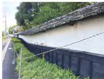
生い茂る樹木の影で、東側の長塀が湾曲し歩道側に傾いています。

【お問合せ先・事務局】 株式会社グローバル・クラウドファンディング内 松浜軒クラウドファンディング係 TEL:096-201-1851 FAX:096-201-3610 メール:info@glocal-cf.com