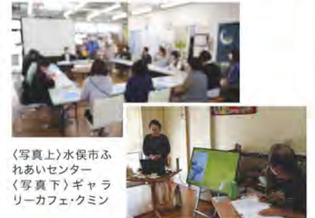
(写真上)水俣市ふれあいセンター (写真下)ギャラリーカフェ・クミン

画中です。内容が決まり次第、やつしろふれすに掲載いたします。里親に関心のある方はもちろん、どなたでもお気軽にご参加ください。