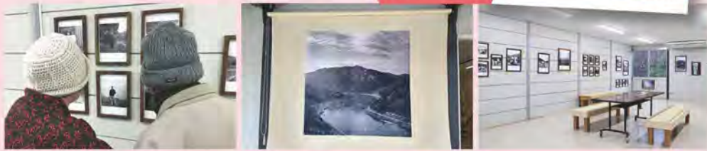
2022年1月に開かれた REBORNプロジェクト写真展の様子▶

私もNYで日系のパン屋が韓国系の店にポコポコとやられるのを20年以上ずーっと見てきました。美味しさや味では勝つてゐるのに、とにかく立ち回りがヘタクソなんです。日本からパン屋のチェーン店が進出してくることもないし、地元の日系パン屋にも将来を見据えた戦略的なアプローチがない。なんかポコポコとしてゐるんですよ。時代を掴んでいくみたいな気概というか意志が見られないんです。でもよく考えたら、これって別にNYの日本人経営パン屋だけじゃなくて、「世界の中の日本」にも当てはまりますよね。ここ30年の日本も同じだったんじゃないかと。さまざまな産業のシェアを失い、他国にどんどん追い抜かれ、でも戦略的アプローチもなく、とにかく立ち回りがヘタクソ。だから私、日本に関して「なんでこうなった?」と思うことがあるんですね。私たち日本人は何を間違ったのか、なぜ間違ったのか、そしてこれからは間違い続けるのか。日本人全員が考えるべきテーマだと思えますよ。