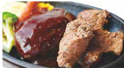
サイコロステーキハンバーグ定食(1,100円・ご飯、スープ付)はサイコロステーキ(150g)とハンバーグ(200g)のセット。

お得な今月の限定ランチもワクワクが止まらない！ステーキ&ハンバーグの魅力たっぷりランチが登場！毎月の限定ランチが大好評のもんじろう。8月の限定ランチは、「サイコロステーキハンバーグ定食(1100円)」は、ステーキ&ハンバーグの黄金コンビ。150gのサイコロステーキと200gのハンバーグがセットになってよければ、あなたにピッタリ。もうひとつの限定ランチは「和牛ロースステーキ定食(1650円)」。強烈なビジュアルの和牛ロースは