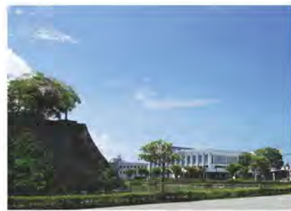
■八代市厚生会館は現在閉鎖中です。八代にとって大変貴重な厚生会館について、その価値をシリーズでお伝えしていきます。■

会館がここには最もふさわしい。 SDGs(エスディーズ)にあるように持続可能で、地球環境に優しい、今あるものを上手に活かしていくこと。八代市厚生会館を解体し廃棄物にしてしまうことより、先人たちが積み重ねた歴史を大切に、魅力あるまちを創っていくことの方が、より無駄がなく将来のためになる。もはや、スクラップ・アンド・ビルドの何でも古くなったら壊して新しく作る時代ではない。 (第16回に続きます→)