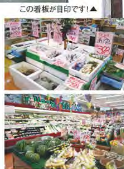
この看板が目印です!▲

〈写真上〉鮮魚コーナー。活きの良い魚は毎朝田崎市場より入荷! 〈写真下〉青果コーナー。新鮮な野菜や果物が種類豊富に並んでいます。