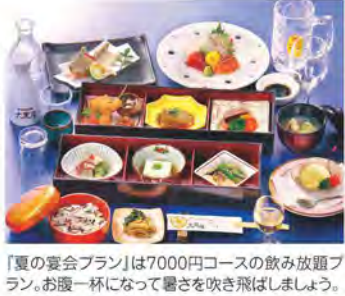
「夏の宴会プラン」は7000円コースの飲み放題プラン。お腹一杯になって暑さを吹き飛ばしましょう。

「仏事会席ほし」7000円コース。季節に合わせた旬の食材を丁寧に料理された、お洒落なコース。 八代市美島町7-15 ※ランチタイム11:00~14:00 ※月曜日 100台 ※無料バス送迎有(10名様以上) Twitter: @hoteldaikokuya facebook: ホテル大黒屋 Instagram: @hoteldaikokuya