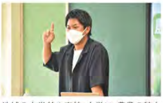
地域の小学校や高校・大学に、農業の魅力を伝える講師として呼ばれることも。