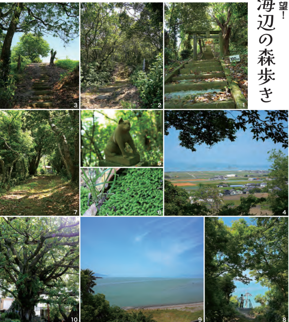
1前平エリアより150段の階段を一気に登ると加藤神社があります。2鳥の鳴き声が響き渡る、心地よい山道。3楠木山古墳へ行くには横階段を上ります。4不知火海と干拓平野が一望! 5独特のフォルムをした狛犬。6日の当たらない地面のいたるところに吾がびつり。7尾張宮古墳へ続く山道。8表紙で紹介した絶景スポット。9階段から眺める不知火海。10階段を降りると巨大なアコウの木が!

八代不知火線(県道338号線)を日奈久方面に向かって進むと、金剛エリアに入ると西側に高低い山・大鼠蔵山が見えてきます。標高46mほどの小山で、入り口から階段を上ると、そこはやさしい木漏れ日。そこはやさしい木漏れ日。昔から町の住民にとって心の故郷であり、子どもたちの遊び場でもある大鼠蔵山。地元町内の皆さんで清掃し、日々のウォーキングコースとしても親しまれています。大鼠蔵山こそ歴史の詰まった玉手箱。これほど身近に、こんなに美しい木々に抱かれる森があったとは驚きでした。