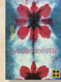
『火の国の女の日記』

詩人、小説家、民俗学者。女性史学のパイオニアである高群逸枝(1894-1964)は、1964年、宇城市出身は、彼女の自伝となる『火の国の女の日記』に「私たちが落ち着いたのは金剛村弥次海岸だった」と書いています。夫で編集者の橋本憲三と共に東京から故郷熊本へ向かい、現在の鼠蔵町の漁師が住む前平地区の貸家を住居にしました。