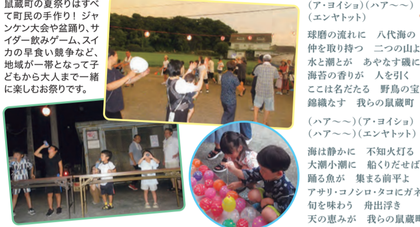
鼠蔵町の年間祭事

昔は漁師さんも多かったけれど今は農家町。以前はすべりいぐさ農家でしたが、現在はレタスやブロッコリーなどの露地栽培、そしてトマトなどを作る二毛作の農家がほとんどです。