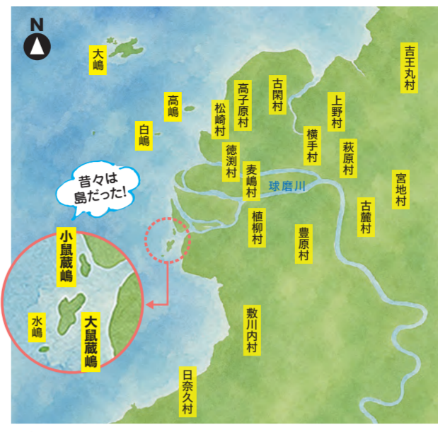
図1: 江戸期の絵地図(伊能忠敬「伊能図大全」参照)

弘化4年(1847)の干拓、昭和元年(1926)の干拓事業により、八代海に浮かぶ小島が陸続きとなりました。江戸期の絵地図(図1)を見てみると、現在の鼠蔵町に流れている球磨川はなく、八代海に浮かぶ島でした。今年(2026年)は、この平和町が含まれる昭和地区の入植100周年(昭和100年)を迎える節目の年でもあります。